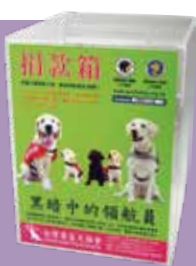
高20cm 寬15cm 深15cm