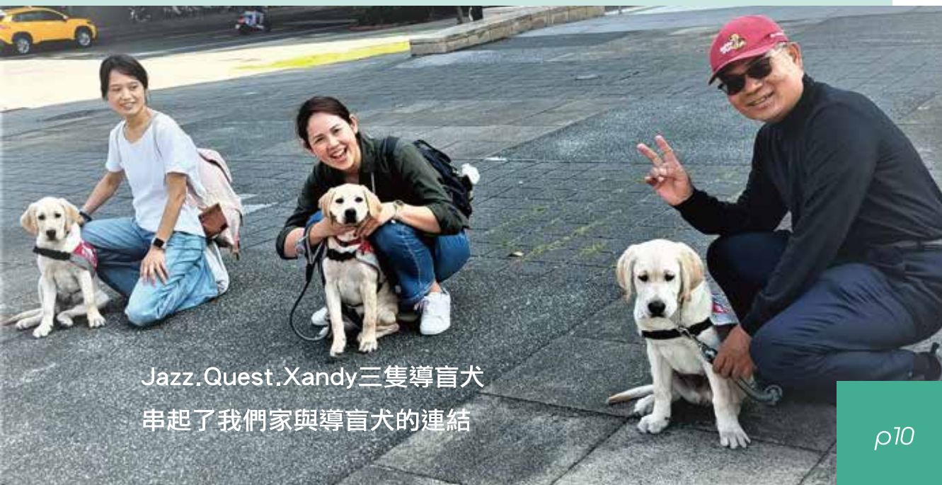
Jazz.Quest.Xandy三隻導盲犬 串起了我們家與導盲犬的連結

我們夫妻可說是協會寄養家庭中「年紀最老的」，感謝協會並未因為我們年長而拒絕我們當寄養家庭，因為當寄養家庭重要是「認同理念」，轉眼我們當寄養家庭即將滿五年，在這期間因為毛孩認識了形形色色的寄養家庭，大家也都不分年紀成為了好朋友，也豐富了我們夫妻退休後的生活。歡迎大家成為導盲犬寄養家庭的一份子，一方面有可愛的毛孩陪伴；一方面也可以為幫助視障者付出一份心力，不要怕帶幼犬的困難，因為~有心就不難喔！